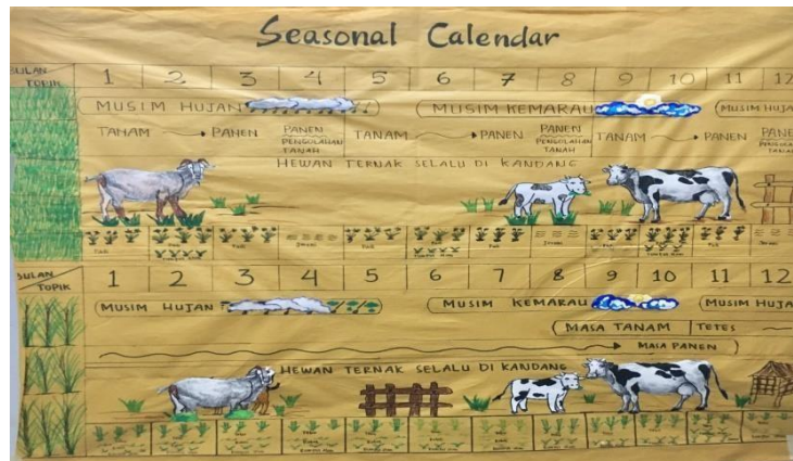
Gambar 7. Seasonal Calendar

Terakhir pada tahun 2019-2021 sungai menjadi bersih kembali, karena pada tahun tersebut potensi objek wisata di Dusun Krajan berupa tubing dan arum jeram sangat ramai dikunjungi para pengunjung dan atlet Lumajang. Namun sayangnya peningkatan potensi tersebut tidak bisa bertahan lama dikarenakan kondisi sungai yang banjir akibat erupsi semeru. Tetapi pada tahun 2023 Tim Mpokdarwis (Tim Objek Wisata) mulai menata kembali tentang potensi objek wisata tubing dan arum jeram yang sempat terhenti akibat bencana alam.