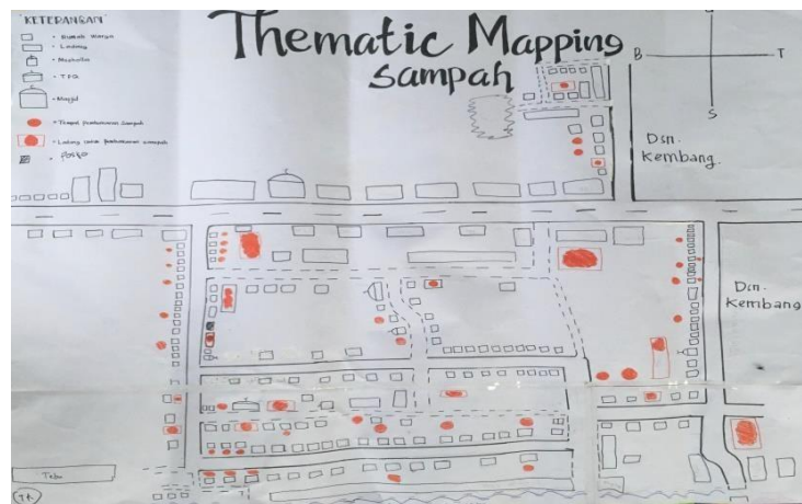
Gambar 4. Thematic Mapping Sampah

Selanjutnya, berdasarkan Thematic Mapping dapat menggali informasi berkaitan dengan problem sampah di Dusun Krajan. Dimana melakukan pendampingan lanjutan untuk mendalami informasi terkait problem sosial yang berkepanjangan yakni problem tidak tersedianya tempat pembuangan sampah, sebagaimana gambar berikut.