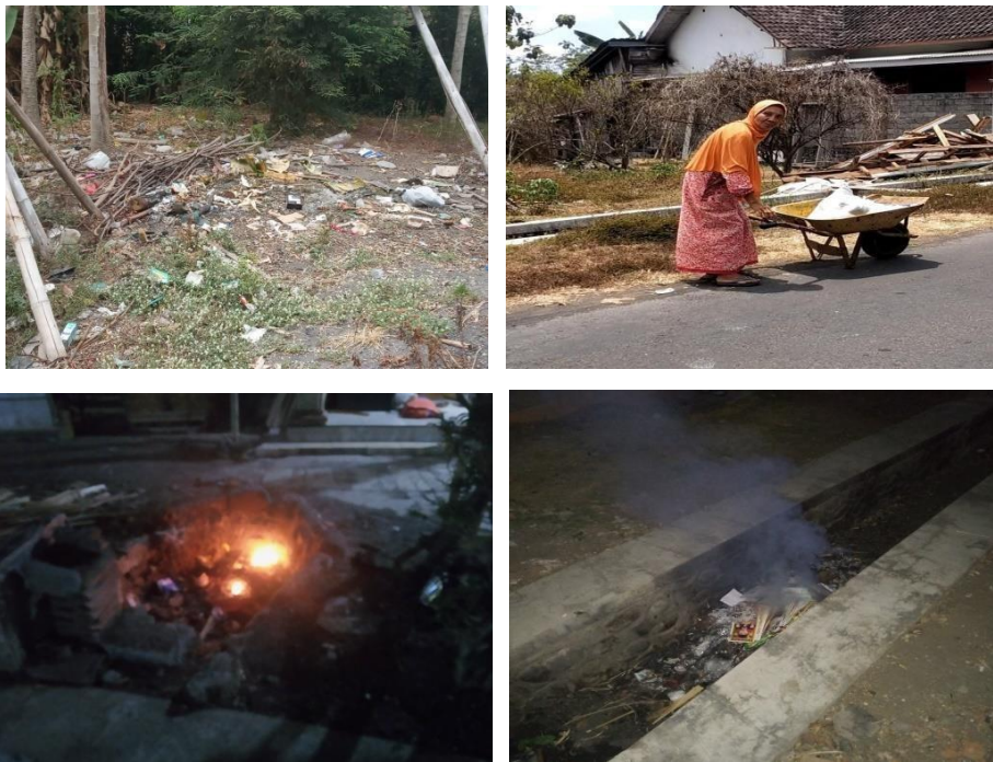
Gambar 1. Banyaknya Tumpukan Sampah Akibat Tidak Tersedianya TPA

Dalam tahapan To Know pada metode PAR, fasilitator mendapat beberapa informasi mengenai problem masyarakat di Dusun Krajan Desa Sentul melalui teknik gambar General Mapping untuk mengetahui beberapa batas Desa, sarana dan titik-titik problem masyarakat di Dusun Krajan, adapun proses pengumpulan data General Mapping yang disusun masyarakat sebagai berikut. Dari gambar General Mapping yang disusun masyarakat dan mendapatkan beberapa gambaran titik problem masyarakat Dusun secara umum meliputi: Ekonomi, Lingkungan, dan Pendidikan. Dapat disimpulkan dari hasil gambar general mapping yang disusun masyarakat dan masih berupa puzzle-puzzle pada setiap RW baik RW 01,02 dan 03 menjadi satu gambar General Mapping sebagaimana gambar berikut: