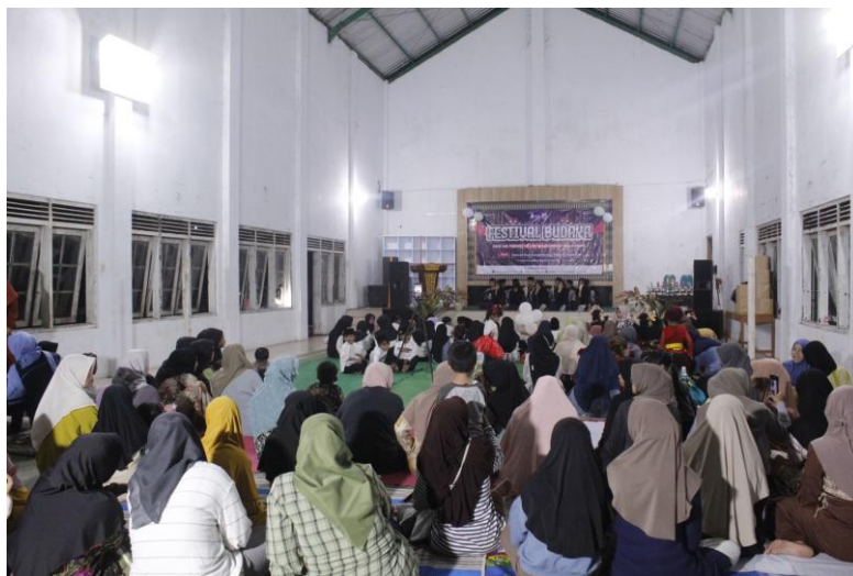
Gambar 1. Pelaksanaan Kegiatan Festival Budaya

melalui penanaman nilai-nilai moral dan sosial seperti kerja sama, gotong royong, tanggung jawab, dan kedisiplinan. Ketiga , pengembangan kreativitas anak-anak dalam mengekspresikan diri melalui seni, memperkuat kepercayaan diri serta keterampilan motorik dan komunikasi mereka.