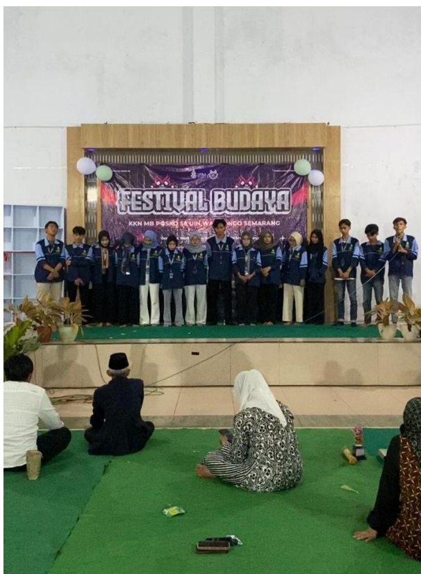
Gambar 2. Perpiahhan dengan Arga Desa

Festival Budaya terbukti menjadi medium efektif dalam merevitalisasi kearifan lokal dan mengaktifkan kembali struktur sosial berbasis budaya. Hasil ini memperkuat argumentasi bahwa pelestarian budaya bukan hanya tentang menjaga masa lalu, melainkan juga tentang membangun masa depan komunitas yang berakar pada nilai-nilai lokal yang hidup dan dinamis.