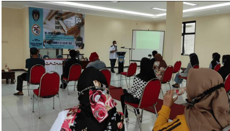
Gambar 4. Suasana Pelaksanaan Bimtek

Mengingat target peserta bimtek berasal dari IKM Kota Pasuruan, maka pembahasan tentang Sinergi kampus dan UMKM dapat membuka peluang kerja sama antara kampus dan UMKM untuk meningkatkan jangkauan pasar masing-masing dan mengeskalisasi mutu yang ditawarkan. Berikutnya, tim pengabdian memberikan pembahasan analisis kelayakan bisnis yang ditinjau dari aspek hukum, sosial ekonomi, dan budaya. Analisis kelayakan bisnis dalam aspek hukum menyangkut semua legalitas rencana bisnis yang akan dilaksanakan sesuai dengan ketentuan hukum yang berlaku. Kepekaan dan kemauan untuk memiliki legalitas usaha berperan sangat penting bagi IKM agar dapat bersaing di pasar bebas. 9