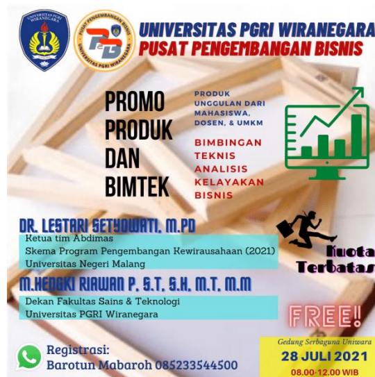
Gambar 1. Pamflet Kegiatan

Kegiatan telah berhasil dilaksanakan pada hari Rabu tanggal 28 Juli 2021. Kegiatan tersebut diselenggarakan di Gedung Serbaguna Lantai 2, Universitas PGRI Wiranegara. Ada 109 calon peserta yang telah mendaftar untuk mengikuti Bimtek Analisis bisnis ini, tetapi hanya 29 peserta diperkenankan untuk ikut karena kebijakan dan aturan Satgas Covid 19 pada PPKM Level III. Keputusan ini diambil sesuai dengan Instruksi Menteri Dalam Negeri Nomor 35 Tahun 2021 tentang Pemberlakuan Pembatasan Kegiatan Masyarakat Level 4, Level 3, dan Level 2, Corona Virus Disease 2019 di Wilayah Jawa dan Bali di mana pelayanan publik yang tidak bisa ditunda pelaksanaannya diberlakukan maksimal 25% partisipan dengan protokol kesehatan secara ketat.