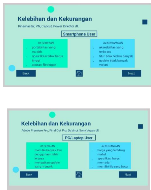
Gambar 5. Perbandingan kelebihan dan kekurangan aplikasi pengolah video di smartphone dengan laptop atau PC

Pada kesempatan kali itu saudara damar juga menyampaikan tentang kelebihan dan kelemahan dari smartphone dengan komputer atau laptop serta kelebihan dan kelemahan masing-masing aplikasi yang diinstal di smartphone dengan laptop atau komputer.