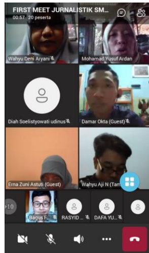
Gambar 1. Pelatihan pertemuan pertama