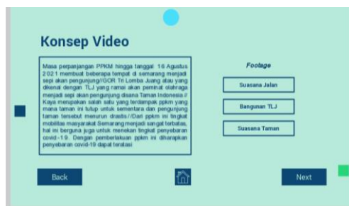
Gambar 4. Contoh Konsep membuat video

Pada materi tentang membuat video jurnalistik sederhana kali ini, saudara Damar memaparkan: