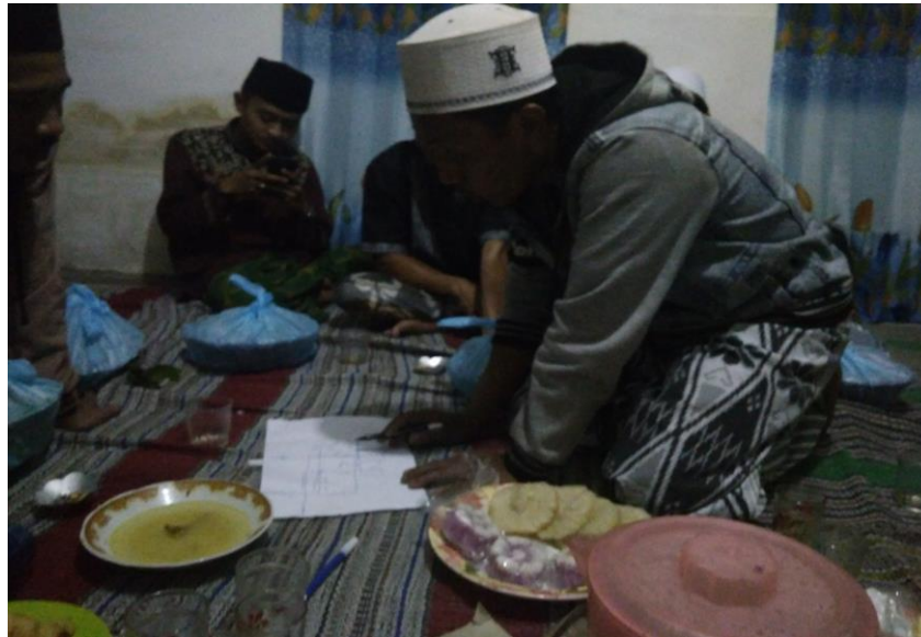
Gambar 2. Proses Thematic Mapping Dusun Wonorejo