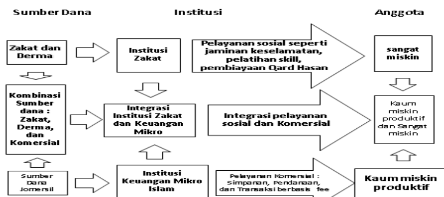
Gambar Integrating zakat and Islamic charities with microfinance

Abdul Ghafar Ismail dan Bayu Taufiq Possumah mengemukakan model zakat berbasis keuangan mikro Islam merupakan sebuah ide yang mencoba mengintegrasikan derma dengan keuangan mikro dan membawa keuangan Islam lebih dekat dengan tujuan syariah untuk mengurangi ketimpangan distribusi pendapatan dan kemiskinan. 30