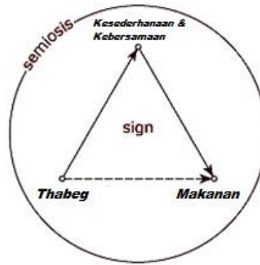
Gambar. 2. Teori Relasi Triadik Charles S. Peirce Pada Tradisi Makan Tabheg di Pondok Pesantren 27

Teori dari Peirce sering kali disebut “ grand theory ” dalam semiotika karena gagasan Peirce bersifat menyeluruh, deskripsi struktural dari semua sistem penandaan pada tradisi makan tabheg . Peirce ingin mengidentifikasi partikel dasar dari tradisi makan tabheg dan menggabungkan kembali semua komponen dalam struktur tunggal. Sebuah tanda atau representamen memiliki arti sesuatu yang bagi seseorang mewakili sesuatu yang lain dalam beberapa hal atau kapasitas. Kebersamaan dalam kesederhanaan merupakan interpretant dari tanda yang pertama, pada gilirannya akan mengacu pada objek tertentu berupa makanan. Dengan demikian menurut Peirce, sebuah tanda atau representamen memiliki relasi “triadik” langsung dengan interpretan dan objeknya. Apa yang dimaksud dengan proses “semiosis” merupakan suatu proses yang memadukan entitas (berupa representamen ) dengan entitas lain yang disebut objek. Proses ini oleh Peirce disebut sebagai signifikasi. 28